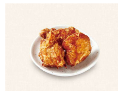
D. 香味唐揚げ (3個) Seasoned Deep-fried Chicken (3P)