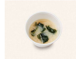
44. 温かい味噌汁 (お湯入り) Miso Soup