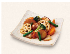
C. 野菜の黒酢あん Sautéed Vegetables with Black Vinegar Sauce