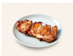
F. もろみチキンステーキ Charbroiled chicken broiled in moromi (soy mash)