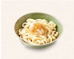
U. ぶっかけおろしうどん Bukkake Grated Udon