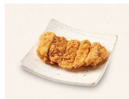
G. チキンかつ Chicken Cutlet