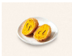
M. かぼちゃコロッケ (1個) Japanese Pumpkin Croquette (1Peace)