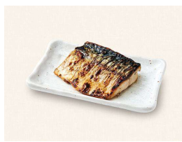
J. さばの塩焼き Charcoal grilled mackerel