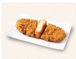
I. 四元豚のロースかつ Deep fried breaded pork loin cutlet