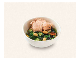
P. ねばねばサラダ Sticky Vegetable