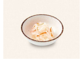
T. 紅白なます Sliced daikon radish and carrots in vinegar sauce