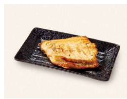
K. しまほっけの塩焼き Charcoal grilled Atka mackerel