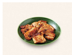
H. やきとり (6個) Yakitori (6P)