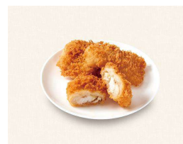
L. 白身魚のフライ (3個) Walleye pollock (3P)