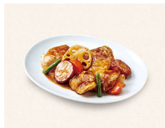
B. すけそう鱈と野菜の黒酢あん Walleye Pollack and Vegetables with Black Vinegar Sauce