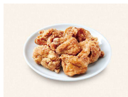
E. 鶏の竜田揚げ (6個) Chicken Tatsuta(6P)