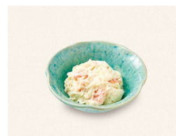
O. ポテトサラダ Potato Salad