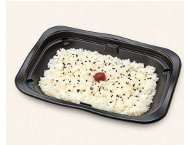
40. ごはん単品 Rice