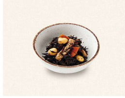
R. ひじきの煮物 Simmered soybean and hijiki seaweed