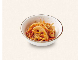
S. きんぴらごぼう Kinpira gobo (braised burdock root)