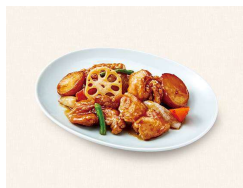
A. 鶏と野菜の黒酢あん Fried Chicken with Black Vinegar Sauce