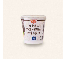
45. カップお味噌汁 (お湯必要) Cup Miso Soup