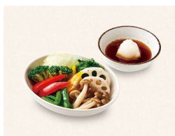
N. 彩り蒸し野菜 Steamed Vegetables